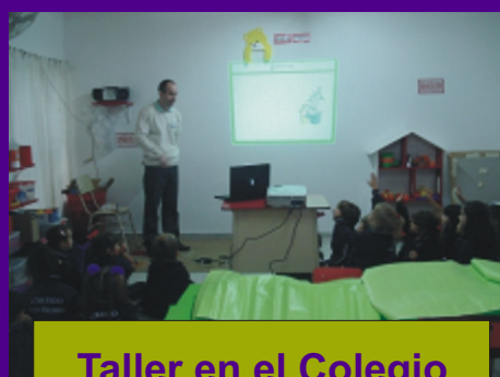
Taller en el Colegio Nuevo San Isidro