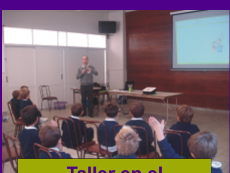
Taller en el Instituto San Martín de Tours